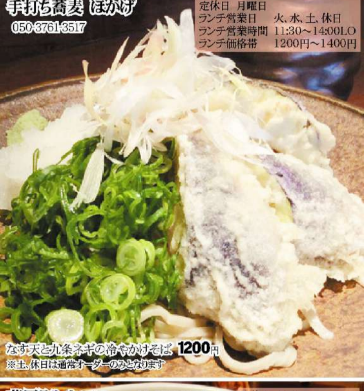
手打ち蕎麦 ほかが 050-3761-3517 定休日 月曜日 ランチ営業日 火、水、土、休日 ランチ営業時間 11:30～14:00LO ランチ価格帯 1200円～1400円