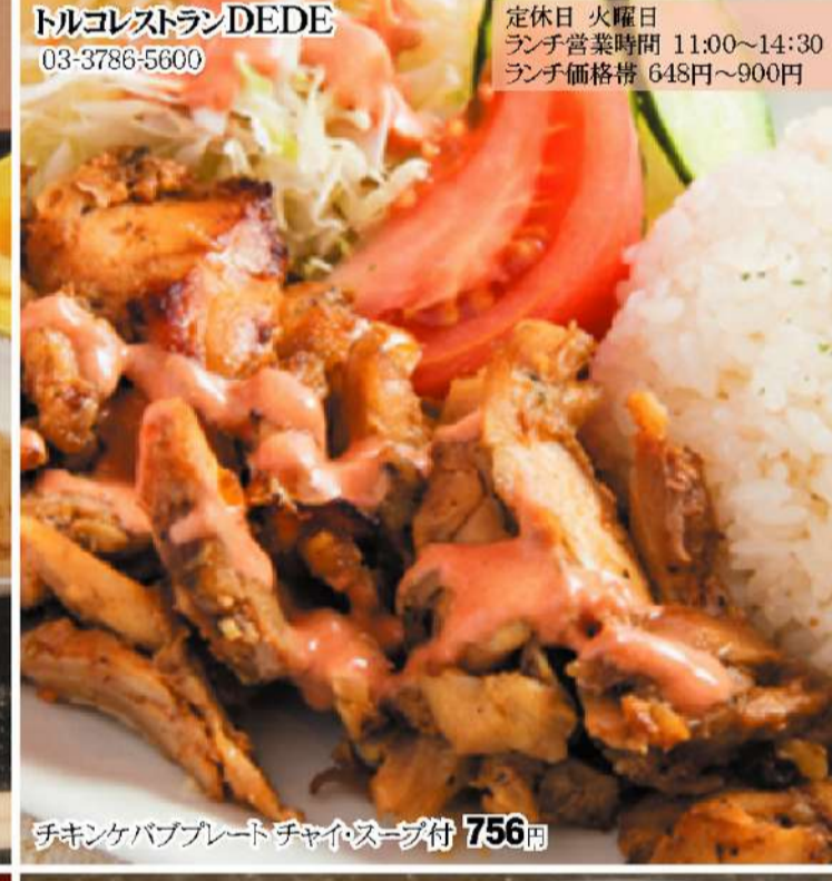
トルコレストランDEDE 03-3786-5600 定休日 火曜日 ランチ営業時間 11:00～14:30 ランチ価格帯 645円～900円