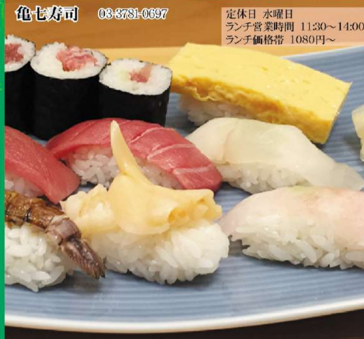
亀七寿司 03-3781-0697 定休日 水曜日 ランチ営業時間 11:30～14:00 ランチ価格帯 1080円～

期間中に対象の13店から6店のお店でランチを召し上がってください。 その際にスタンプラリー応募用紙にそれぞれのお店のハンコをもらってください。 6店のお店のハンコが集まったら、その応募用紙を持って、対象店のお店でランチの際に用紙をお出し下さい。 ランチ1食(1000円以内)が無料になります。 (実施期間中に無料ランチも召し上がってください。) 無料ランチが1000円を超えた時は差額をお店にお支払い下さい。