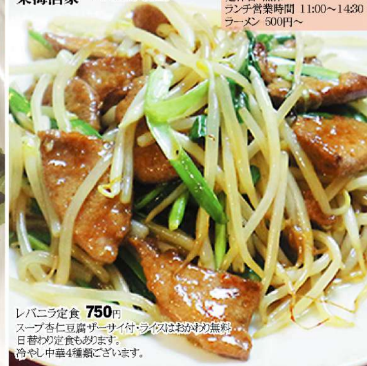
東海酒家 03-6426-6818 定休日 無休 ランチ営業時間 11:00～14:30 ラーメン 500円～