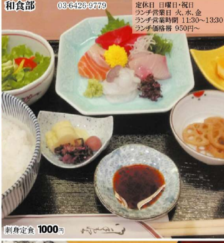
和食部 03-6426-9779 定休日 日曜日・祝日 ランチ営業日 火、水、金 ランチ営業時間 11:30～13:30 ランチ価格帯 950円～