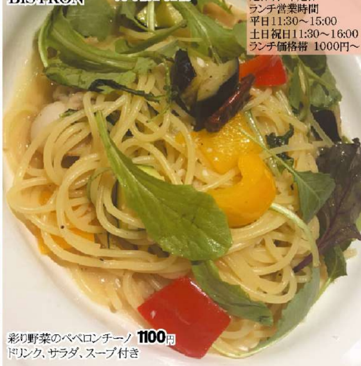
BISTRON 03-6451-8143 定休日 不定休 ランチ営業時間 平日 11:30～15:00 土日祝日 11:30～16:00 ランチ価格帯 1000円～