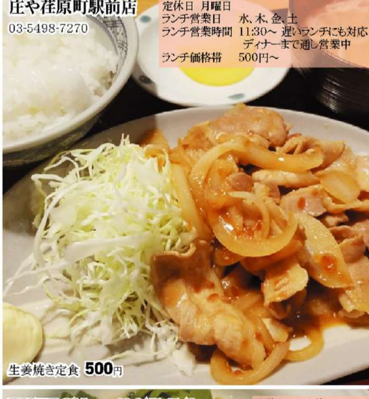
庄や桂原町駅前店 03-5498-7270 定休日 月曜日 ランチ営業日 水、木、金、土 11:30～ 遅いランチにも対応 デイナーまで通し営業中 ランチ価格帯 500円～