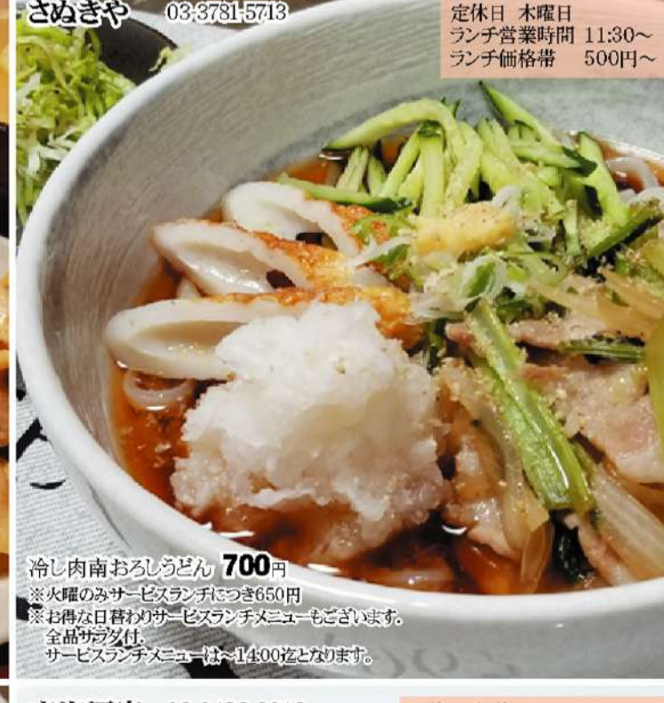
さぬきや 03-3781-5713 定休日 木曜日 ランチ営業時間 11:30～ ランチ価格帯 500円～