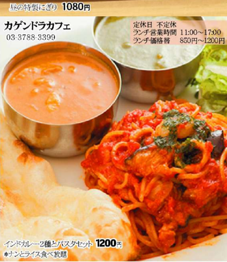
嵐の特製にぎり 1080円 カゲンドラカフェ 03-3788-3399 定休日 不定休 ランチ営業時間 11:00～17:00 ランチ価格帯 850円～1200円