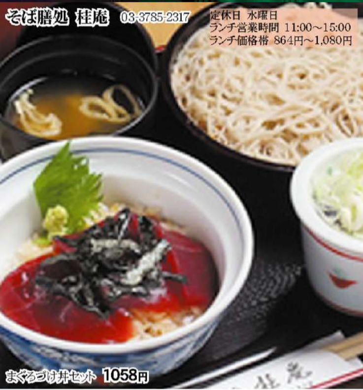
そば膳処 桂庵 03-3785-2317 定休日 水曜日 ランチ営業時間 11:00～15:00 ランチ価格帯 864円～1,080円