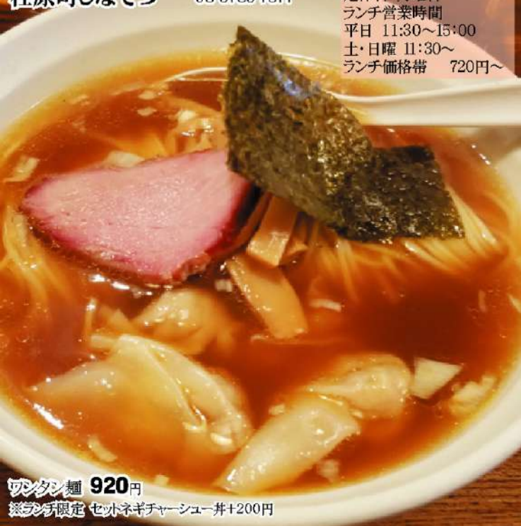
桂原町しなてつ 03-3785-7877 定休日 月曜日 ランチ営業時間 平日 11:30～15:00 土・日曜 11:30～ ランチ価格帯 720円～