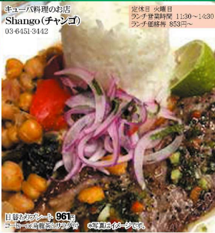
キューバ料理のお店 Shango(チャンゴ) 03-6451-3442 定休日 火曜日 ランチ営業時間 11:30～14:30 ランチ価格帯 853円～