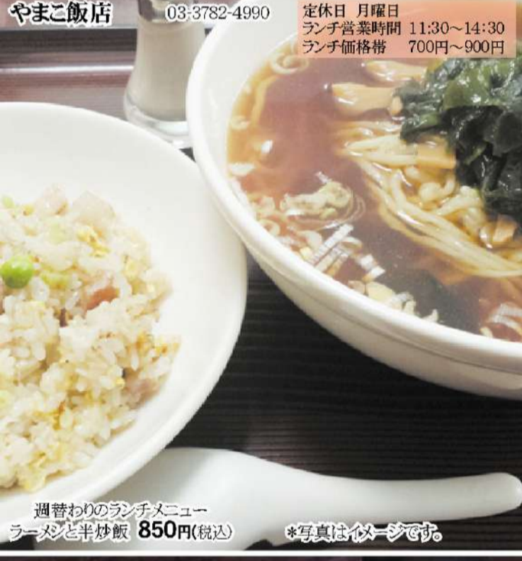
やまこ飯店 03-3782-4990 定休日 月曜日 ランチ営業時間 11:30～14:30 ランチ価格帯 700円～900円