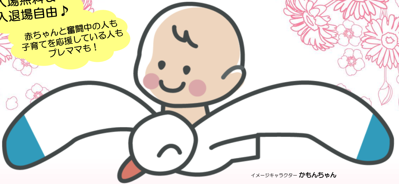
イメージキャラクター かもんちゃん