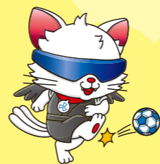
品川区 ブラインドサッカー応援キャラクター やたたま