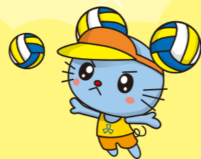
品川区 ビーチバレーボール応援キャラクター ビーチュウ