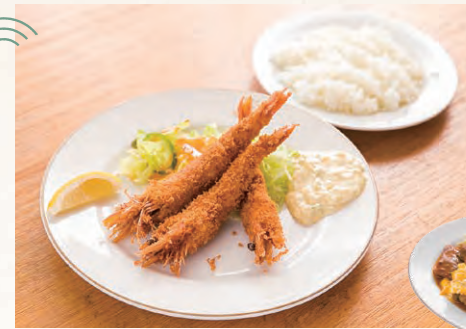
頭から尻尾まで丸々いただくことのできる天使の海老を使った天使の海老フライ(1,700円)。曜日別の日替わりランチの場合1,480円)

旧東海道に立つ数寄屋造のそば店。安政3(1856)年に鮫洲で創業し、大正元(1912)年に現在の地へと移ったそう。趣ある店内では、群馬県赤城山のそばの実を自家製粉した香り高い手打ちの十割そばや季節の一品料理、旬の味覚をふんだんに取り入れたそば会席が楽しめます。鹿児島枕崎産の1本釣り本枯れ鰹節を直前に削って出汁をとるおつゆも絶品です。