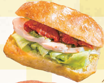
低温調理した鶏肉と バジルソースの バジルチキンサンド(420円)