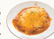
スペシャルオムライス(1,320円)※夜限定