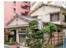
毎日、石臼でひいています

昭和38(1963)年創業。3代目店主が暖簾を守り、三たてのおそばがいただけます。群馬県赤城村の常陸秋そばのみを使用、そば粉10に対し小麦粉2を加える外二そばです。江戸蕎麦御三家のひとつ更科の直系店とあり、旬の食材を練り込んだ色あざやかな、更科伝統の「季節の変わりそば(1,150円)」も楽しめます。