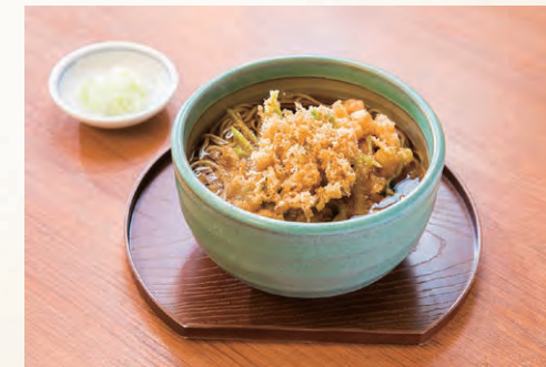
芝エビや三つ葉をカラリと揚げた、かきあげ天ぶらそば(1,870円)

☎03-3761-7373 品川区南大井3-18-8 11:30~15:00(LO14:40)、17:00~20:00(LO19:45)、祝日11:30~15:00(LO 13:30) 日曜 京急線大森海岸駅から徒歩5分