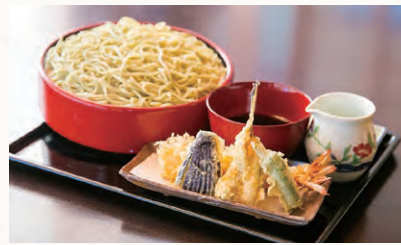
天せいろ(3,300円)。 贅沢に大車海老、魚、野菜の天ぶらを添えて

1階テーブル席のほか、錦鯉が泳ぐ池を囲み、掘りごたつの座敷席、特別室、2階の宴会席などがあります(個室利用には別途サービス料が必要)