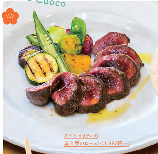
スペシャルティの 屋久鹿のロースト(1,980円~)