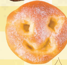
バターと卵がたっぷり、 リッチな味わいの ブリオッシュ・にこにこパン (172円)