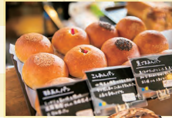
奥久滋卵使用の 自家製カスタードクリームが 詰まったクリームパン(162円)