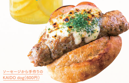
ソーセージから手作りの KAIDO dog(600円)