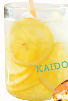
皮ごと食べられる 有機栽培レモンを使用した 自家製レモネード(550円)