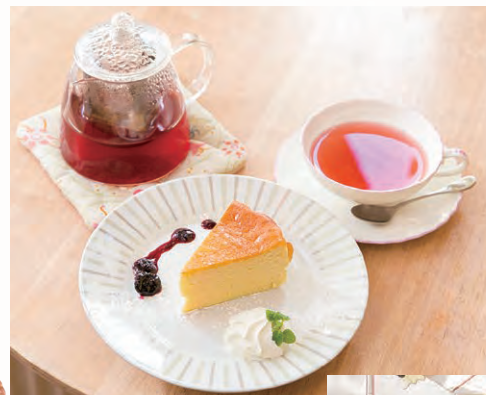
サワークリームが入った N.Y.スタイルのチーズケーキ400円、 ローズヒップのブレンドティー350円