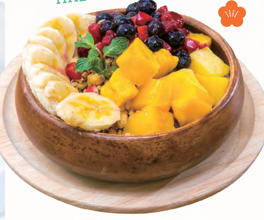
マンゴーや大粒のベリーがどっさりつた アサイーボウル(レギュラー1,320円)