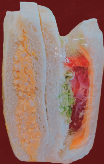
ヨシナカブレッド